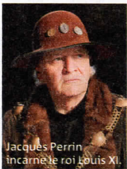
Jacques Perrin incarne le roi Louis XI.

dien est également chirurgien et cancérologue. « Certains de mes patients sont parfois étonnés », s'amuse-t-il. Pourtant, il estime que ses deux vocations se nourrissent l'une l'autre : « Il faut savoir écouter, respecter les silences, aimer le contact ». Depuis son plus jeune âge, l'homme a deux amours : la